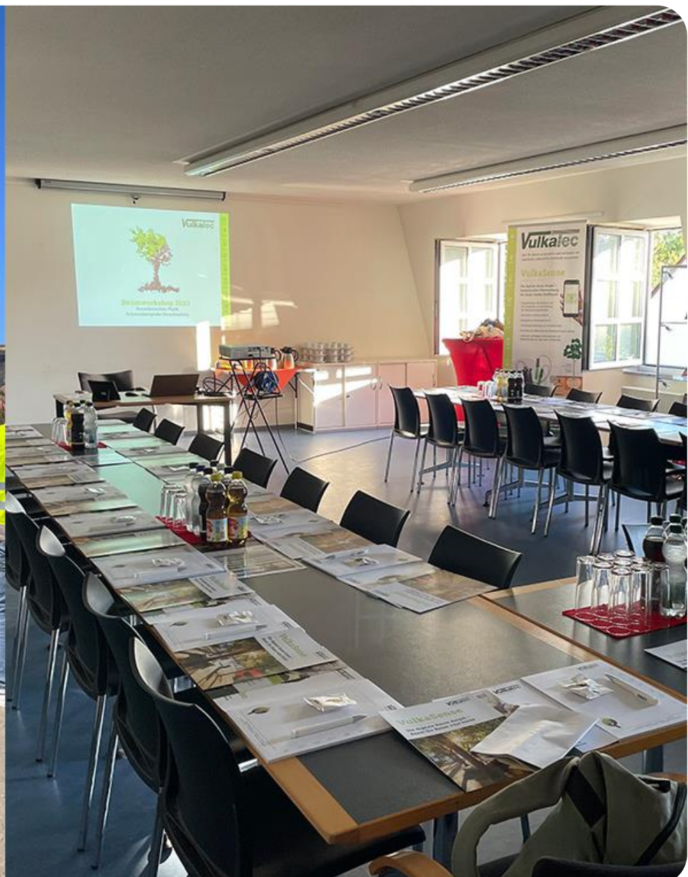
Baum Workshop 2023 Bilder aus der Lavagrube Herchenberg und dem Informationszentrum Vulkanpark