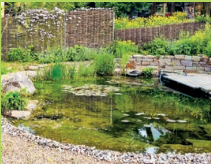
Rybník na soukromé zahradě, Dattenberg

Ekologické ozelenění jezírka substrátem Zeoclear